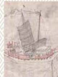
津島日記・下巻<多久展示> (朝鮮通信使船図) 草場佩川筆 多久市郷土資料館蔵