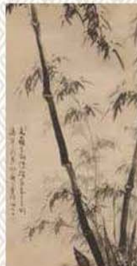
竹図並賛 草場佩川筆 個人蔵