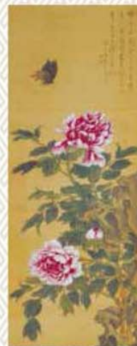
牡丹図並賛 草場佩川筆 個人蔵