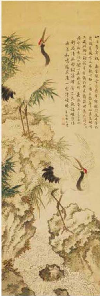
双鶴図並賛 草場佩川筆 個人蔵

草場佩川(くさばはいせん/1787年~1867年)は、肥前多久に生まれ、多久領の学校の東原庵舎と佐賀藩校の弘道館で学び、早くから学問をはじめ詩文と書画で頭角をあらわしました。文化8年(1811年)数え年25歳の時、朝鮮通信使との幕府側応接に加わり、その詩文や書画を披露、通信使たちから「奇才」と絶賛され、広く知られる存在となりました。