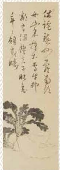
女山大根図(野菜・草花図並賛屏風) 草場佩川筆 個人蔵