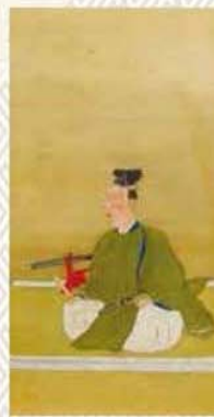
多久茂郷像 草場佩川筆 多久市郷土資料館蔵