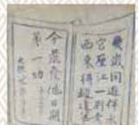
大隈重信自筆寄書 個人蔵 ※弘道館在学中、17歳の貴重な資料

※<多久展示>は多久市郷土資料館、 それ以外は、佐賀県立博物館で展示いたします。